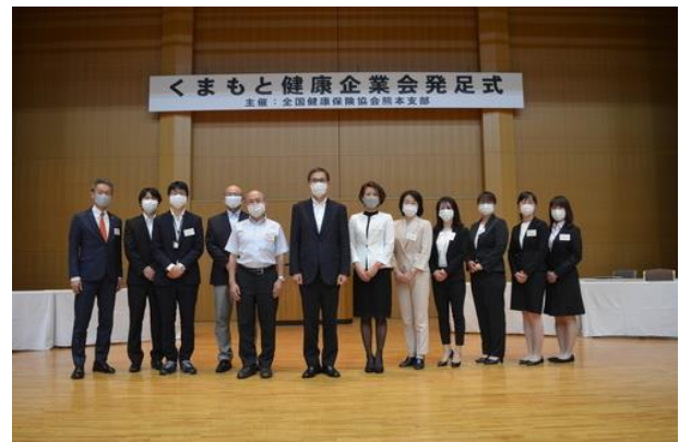
くまもと健康企業会

また、協会けんぽが補助的な役割となり、参加企業の健康経営に資する活動を裏で支え支援していることが特徴です。